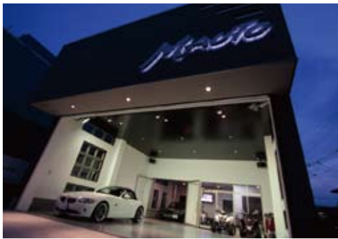
店舗(ショールーム)兼住宅の建築実例。「生活感」を出さないことが至上命題だった。特殊な条件も建築家のアイデアで克服し「+αの提案」設計は建築家・山口さん。