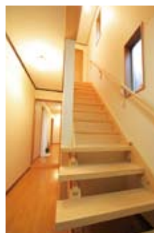
一部の壁を無くし、上層の圧迫感を払拭した階段。こうしたきめ細やかな配慮やこだわりを表現できるのも、建築家と直接家づくりを進めていく醍醐味。設計は建築家・山口さん。